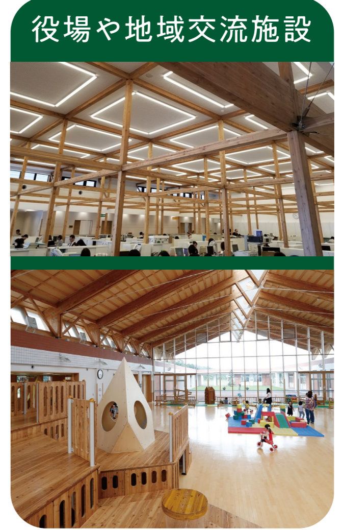
役場や地域交流施設

役場や学校、地域の交流施設や、 お店、カフェ、ホテル、旅館など… 北海道のまちにも、木をつかった建物が 少しずつ増えてきています。