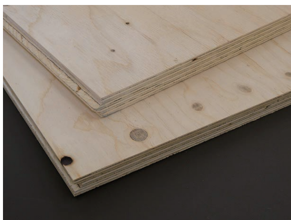
トドマツ構造用合板

北海道産トドマツ合板は、寒さの厳しい環境で成長した良質な原木を用い生産され、寸法安定性に非常に優れております。その上、木肌が白くキメ細かく滑らかな表面性を持ち、内装用途での使用も十分に可能とするほどの優れた意匠性を有しております