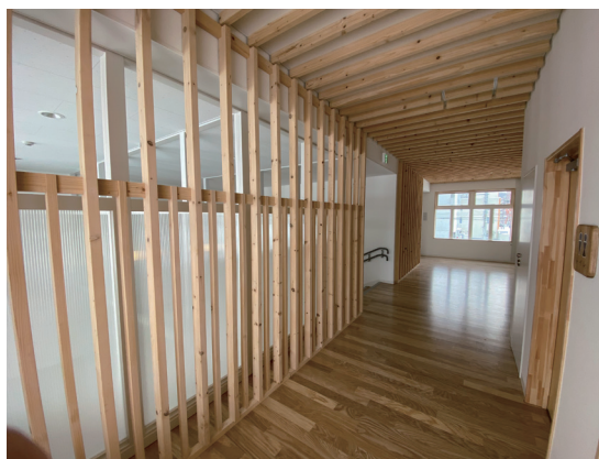
とど松準不燃ルーバー