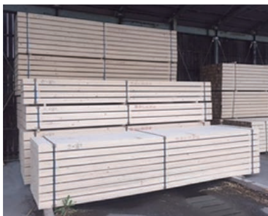
トドマツ一般製材

製品説明 北海道産トドマツ材の良質・良材が特徴 2面プレーナ仕上げにて寸法が保たれています。