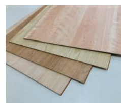
ザ・ニューノルデン