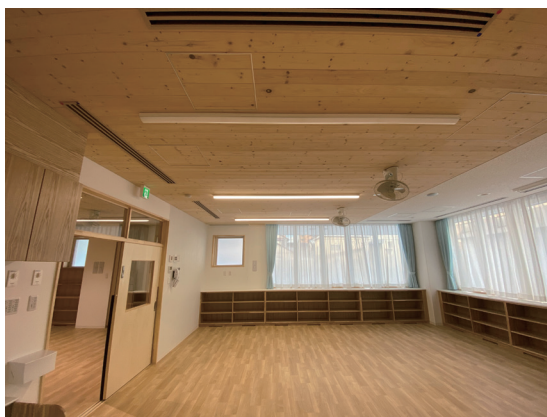
とど松準不燃羽目板

内装制限のかかる建物でも仕上げ材には不燃木材が必要不可欠です。 天然木ならではの風合い・肌触り・重厚感是他には出せないものです。 又、夏場の湿度調整・ヒートアイランドにも優れている材です。