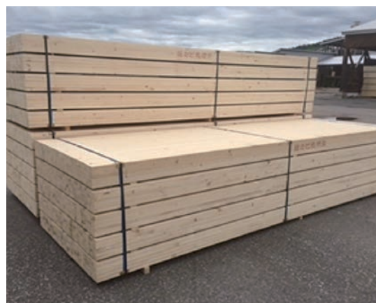
トドマツ型枠用栈木