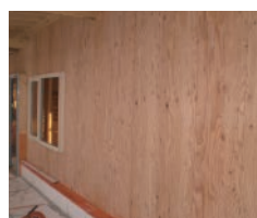
カラマツ構造用合板