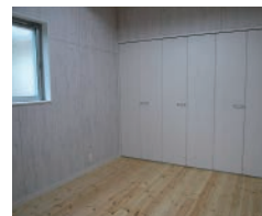
エコグレイン シャビィ