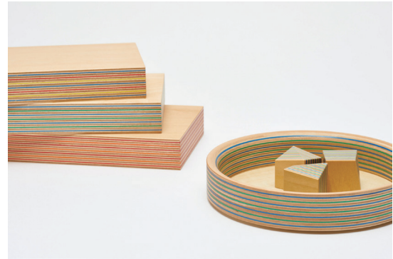
Paper-Wood series I (厚30mm)と使用例