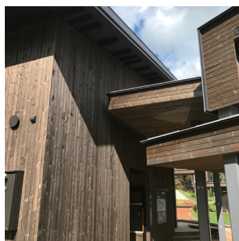
外壁用羽目板 施工例(トドマツ材使用)