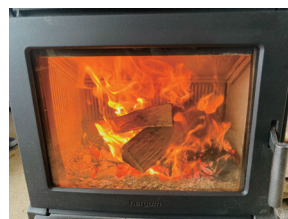
弊社の薪ストーブにて使用している様子