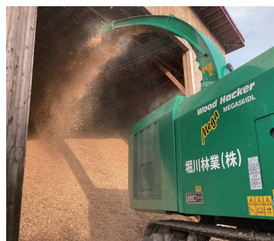
チッパー機での切削状況