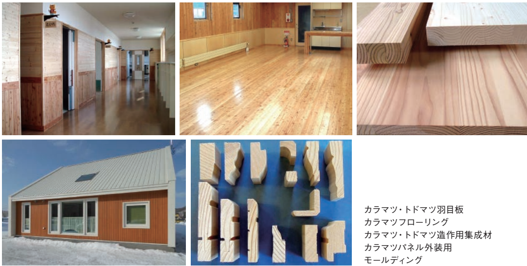
カラマツ・トドマツ羽目板 カラマツフローリング カラマツ・トドマツ造作用集成材 カラマツパネル外装用 モールディング

北海道産カラマツ・トドマツの木目の美しさ、木材ならではの湿度調整に優れ、過ごしやすく人にやさしい環境を作り出します。 無垢材ならではの質感は、音の響き、光の反射などの特性に優れ、本物志向のユーザーに強く支持されています。