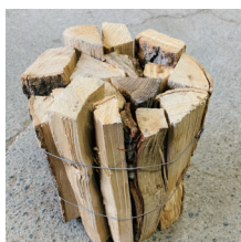
アウトドア用 束薪