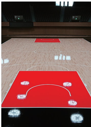
体育館専用フローリング