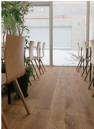
リバティウッド スネークフロア

創立時より製造販売を続け全国に多数の施工例があり、高い評価を得ています。北海道内は営業施工部が直営で責任施工を行います。