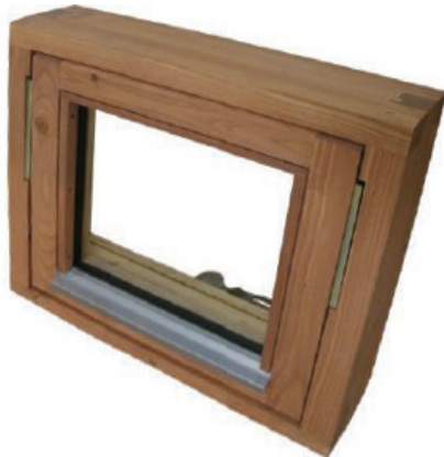
道産カラマツ木製サッシ(回転窓タイプ)

寒さの厳しい北海道で三十年以上の実績を積み重ねてきました。樹種は道産カラマツのほか、アッシュを採用。高耐久の熱処理木材・ローステッドアッシュも可能です。素材を生かした重厚なつくりは、意匠性を高めるとともに、高断熱を実現しています。