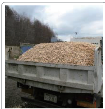
木材チップ(ひじき状)の例

道産木材の間伐材などのチップ材とゴムチップを特殊アスファルト乳剤や顔料等で混合・敷設した舗装で、自然とマッチした景観性と自然の道(土・落ち葉の道等)と同じ柔らかさを有しており、公園・遊歩道・散策路に適しています。