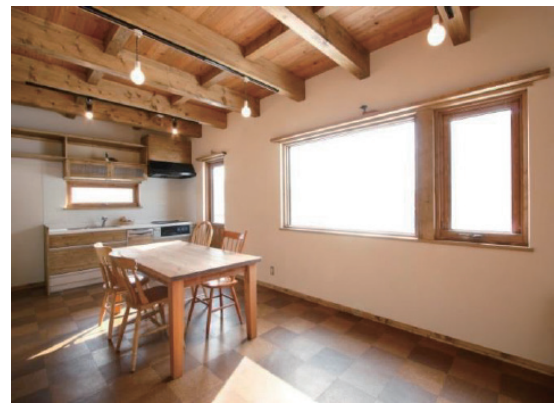
施工例:道産カラマツ木製サッシ