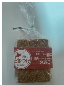
足寄のたきつけ(袋) 1袋 3P1シート×2枚