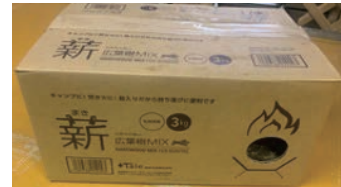
広葉樹 MIX 薪