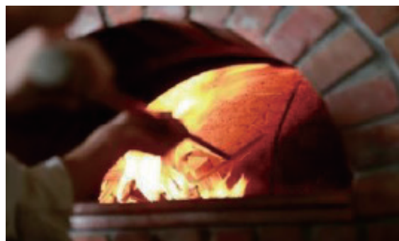
実際に納品先で使用されている写真