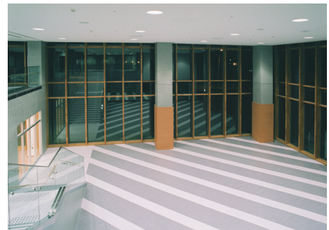
北海道産カラマツ