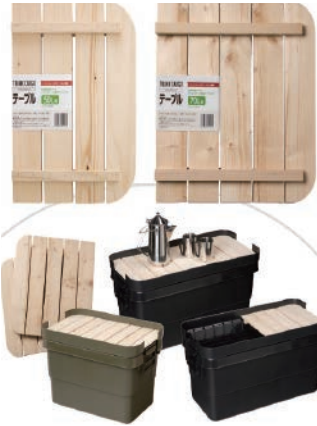
トランクカーゴテーブルすのこ