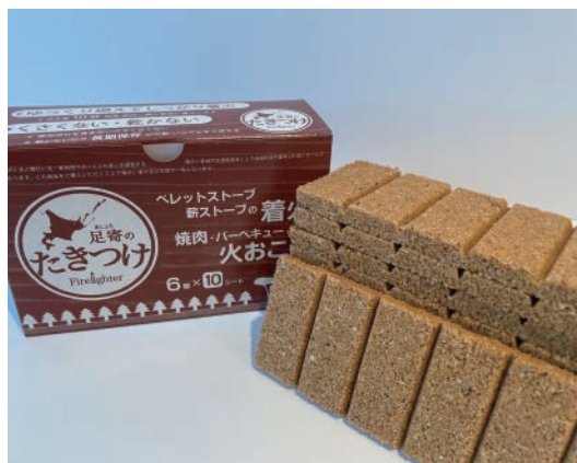
足寄のたきつけ(箱) 1箱 6P 1シート×10枚

道産木材のおが粉と廃ろうそくを原料にしたエコなたきつけです。揮発剤を使用していないので長期保管が出来、使用時に特有の嫌な臭いがしません。10分近く燃焼するので炭の着火にもおすすめです。ペレットストーブ、薪ストーブ、炭等の火おこしにご活用下さい。