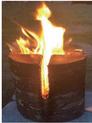
スウェーデントーチ