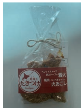
足寄のたきつけ(星型) 1袋 約50グラム入り (4~5ピース)