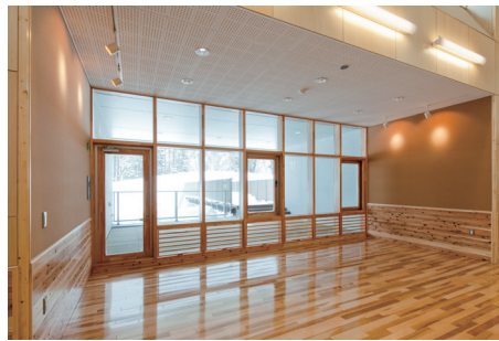
北海道産カラマツ